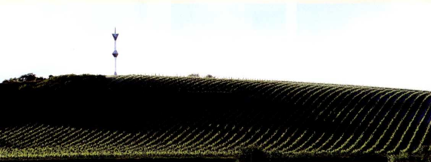
Die Lage Kirchberg in Winden mit abgezirkelten Reihen von Blaufränkischreben.